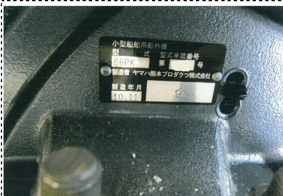
写真10 銘板(プレート)