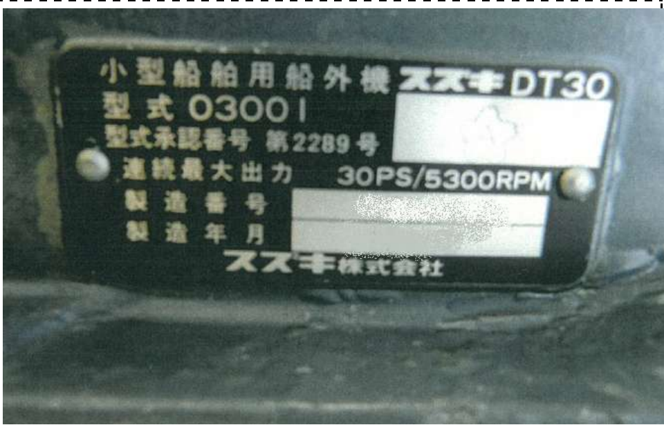
写真4 銘板(プレート) (型番)