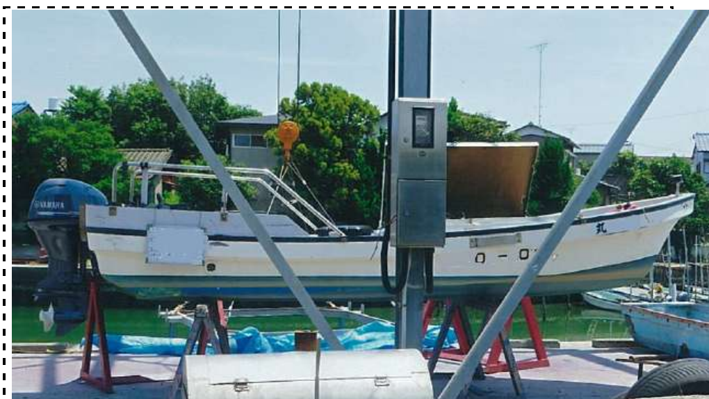
写真8 導入後船全景