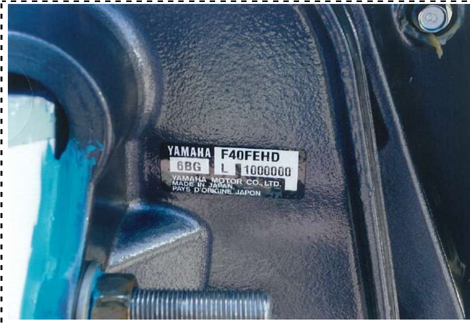
写真9 銘板(プレート) (型番)