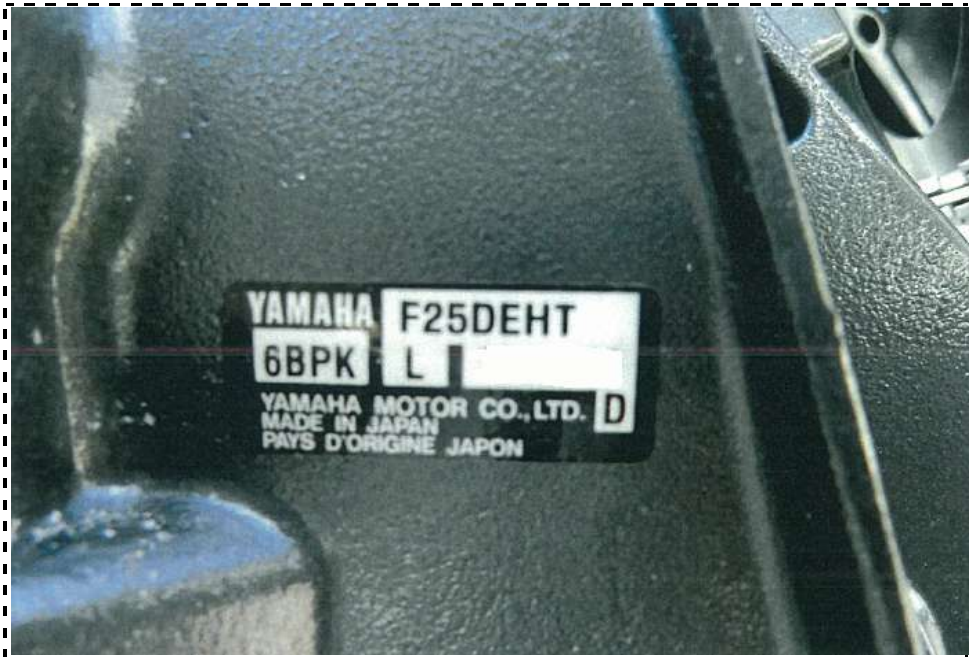
写真9 銘板(プレート)