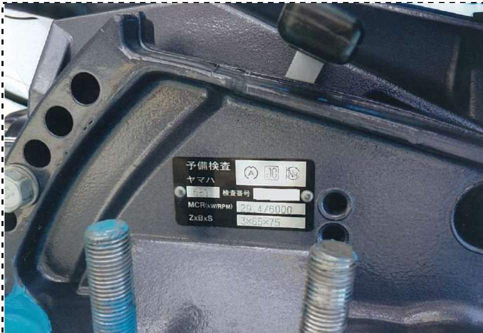
写真10 銘板(プレート) (型番)