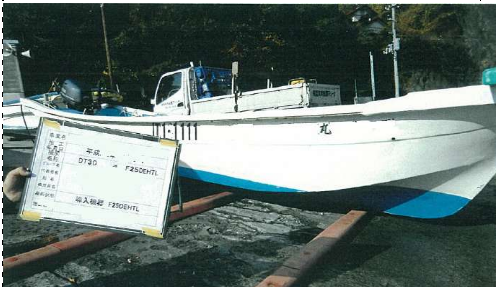
写真8 導入後船全景